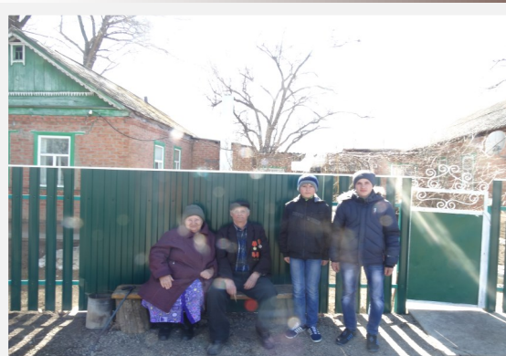
Дети войны нашего хутора. Стр. 3