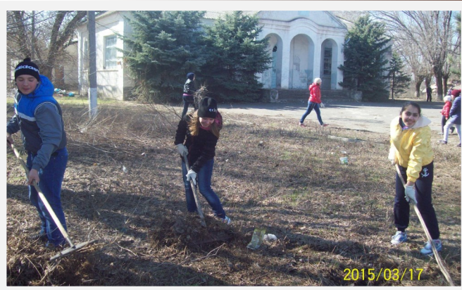
Наши дела к 70 летию победы. Стр 4

Главный редактор: Затула Руслан Фотокорреспондент: Школа Владимир Редактор: Школа Мария Руководитель: Кузнецова Людмила Юрьевна и Зубкова Таисия Анатольевна.