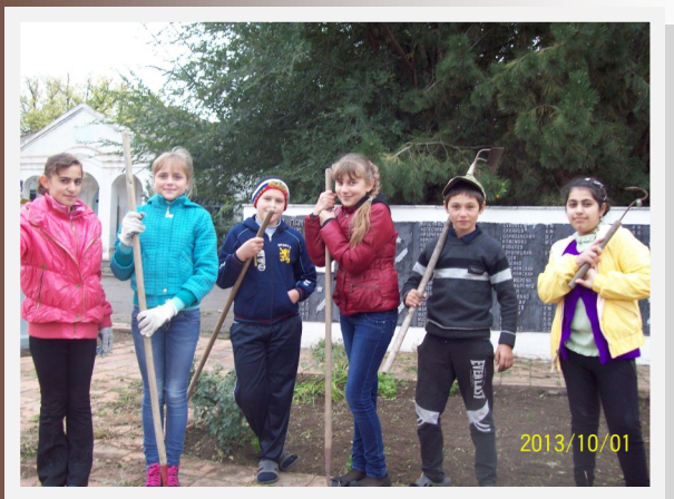
Наши дела к 70 летию победы. Стр. 4