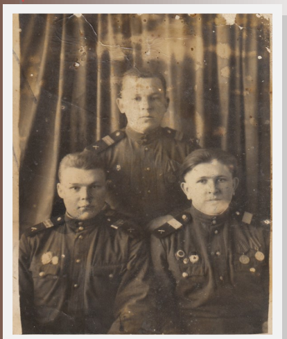
Я горжусь своим прадедом . Стр. 2